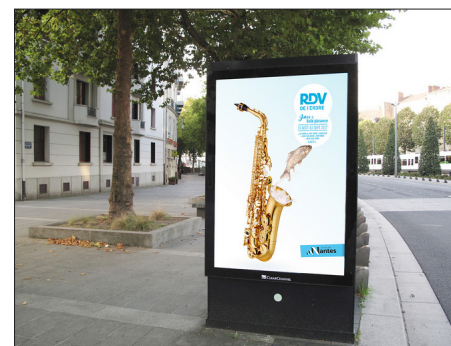
Création de visuel pour un EP réalisé pendant la formation (sélection iconographique, photomontage et dessin vectoriel)