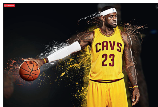
Exemple de photomontage