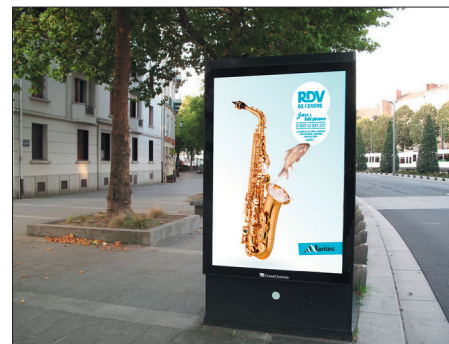
Création de visuel pour un EP réalisé pendant la formation (sélection iconographique, photomontage et dessin vectoriel)