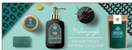
Exemple de création de planches tendance