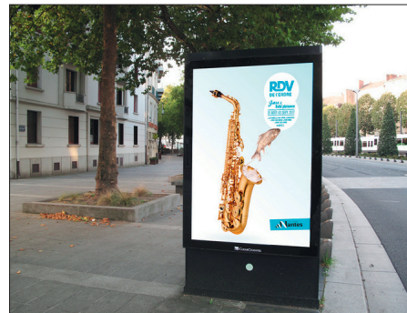
Création de visuel pour un EP réalisé pendant la formation (sélection iconographique, photomontage et dessin vectoriel)